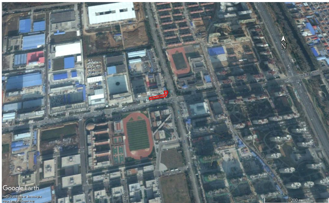
图 2-12 2016 年 12 月 Google Earth 卫星影像图

根据 2013 年 08 月 Google Earth 卫星影像图，调查地块相邻地块西侧新建一处公共服务用地（学校），东南侧居住用地被拆迁。