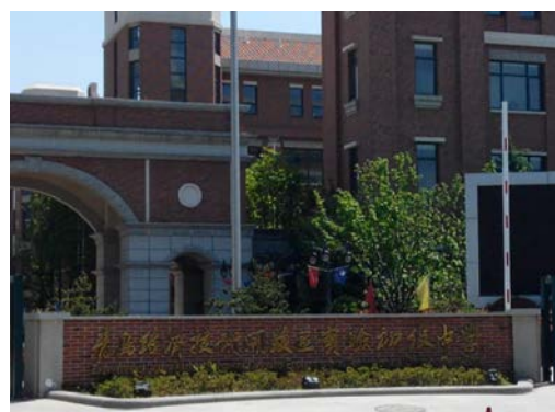
南侧西海岸新区实验初级中学