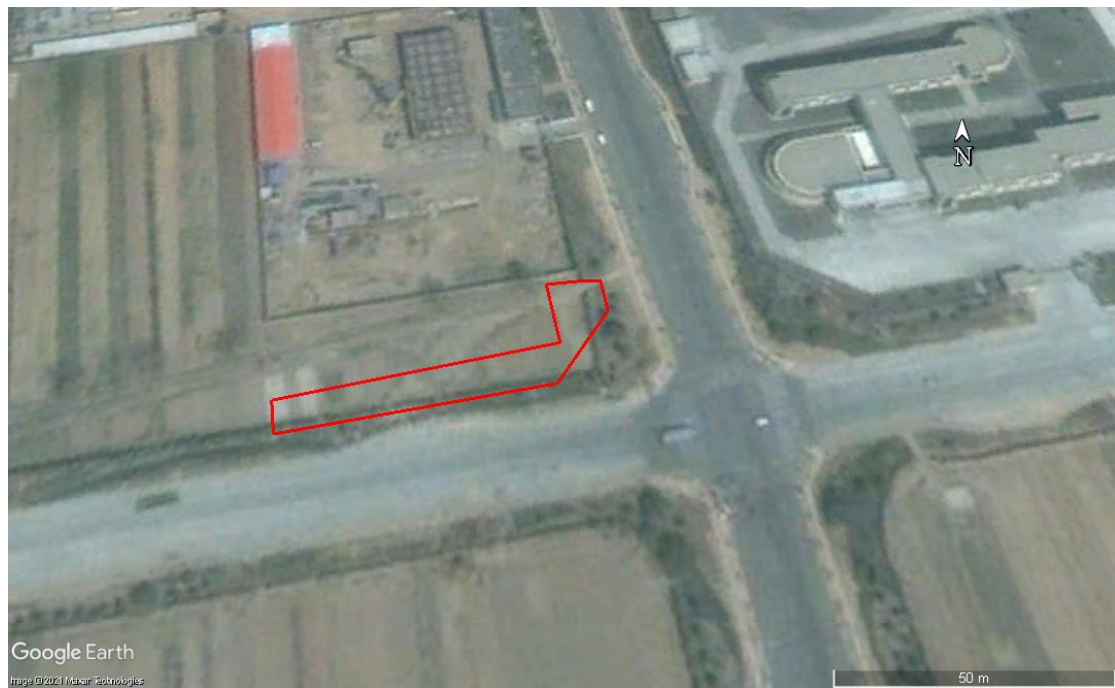
图 2-2 2005 年 04 月 Google Earth 卫星影像图

根据 Google Earth 卫星影像图，富春江路北、峨眉山路西以东地块 2005 年前为耕地；2010 后开始建设有少量建筑物；2019 年拆迁后成一片空地；2021 年地块上有建设施工痕迹。