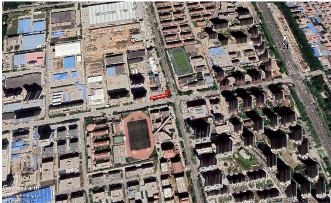
图 2-14 2021 年 05 月 Google Earth 卫星影像图

根据 2019 年 09 月 Google Earth 卫星影像图，调查地块相邻地块东南侧居住用地已经建好。