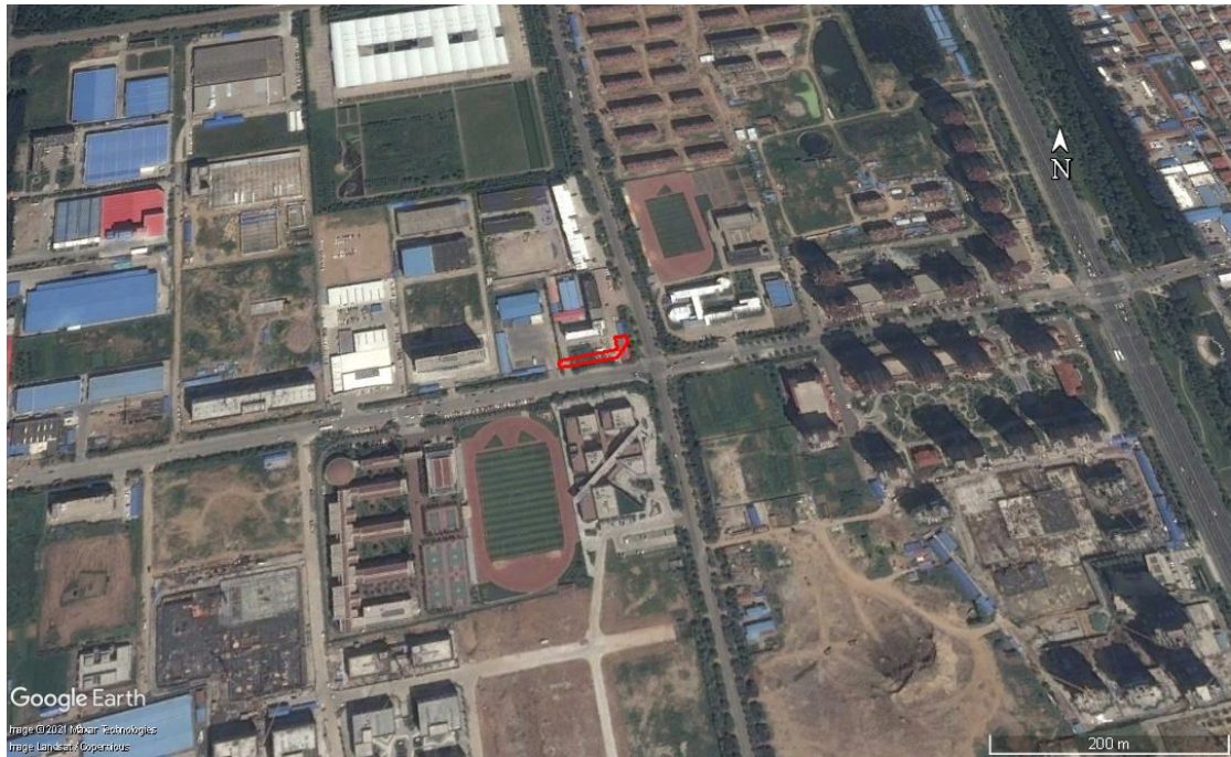
图 2-11 2013 年 08 月 Google Earth 卫星影像图

根据 2013 年 08 月 Google Earth 卫星影像图，调查地块相邻地块西侧新建一处公共服务用地（学校），东南侧居住用地被拆迁。