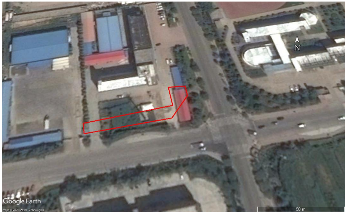
图 2-4 2013 年 8 月 Google Earth 卫星影像图

根据 2010 年 1 月 Google Earth 卫星影像图，调查地块中部偏北位置建设有一栋小型的楼房。