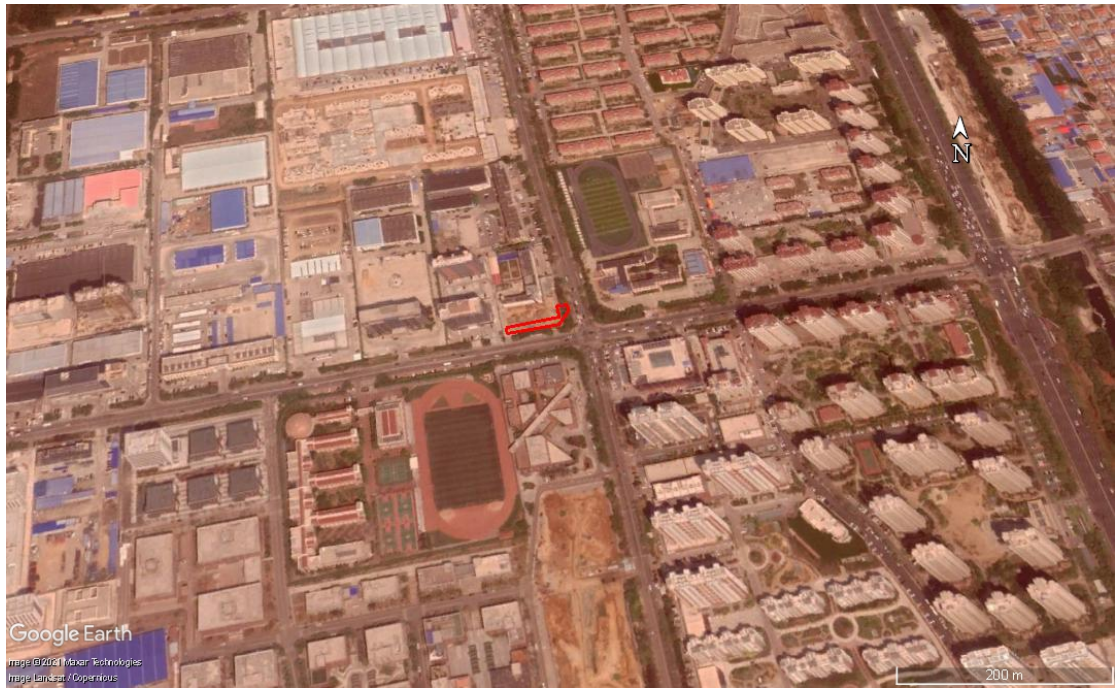
图 2-13 2020 年 05 月 Google Earth 卫星影像图

根据 2019 年 09 月 Google Earth 卫星影像图，调查地块相邻地块东南侧居住用地已经建好。