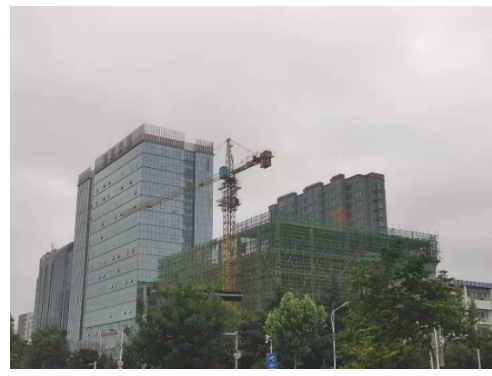
项目内部施工情况