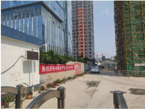
项目内部施工情况