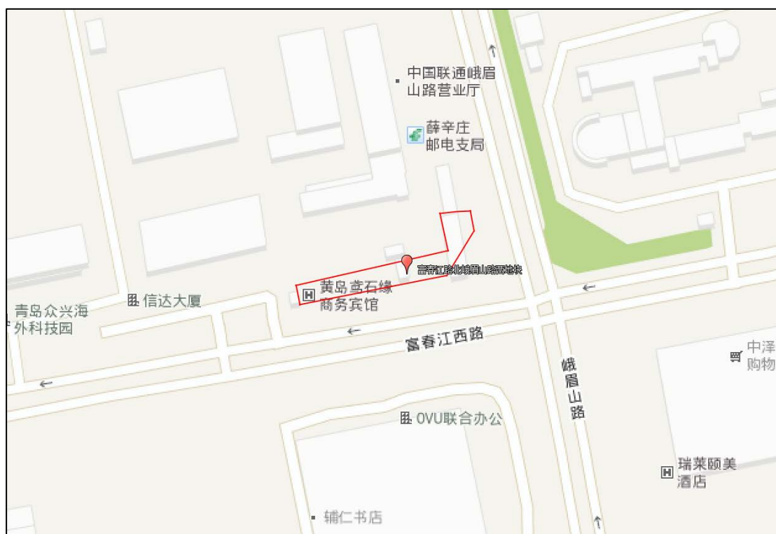
图 2-1 地块地理位置图