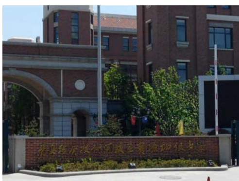
南侧西海岸新区实验初级中学