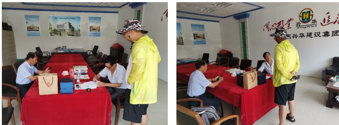
图 3-2 调查地块人员访谈情况

通过与地块管理单位、地块周边企业和群众等以当面交流、电话交流等方式进行了访谈，了解调查地块及周边地块历史沿革、工业生产情况、环境污染事故、周边环境敏感点等信息，核实已有的资料信息，补充获取地块相关资料信息。人员访谈现场及访谈记录见图所示，人员访谈记录表详见附件 9。