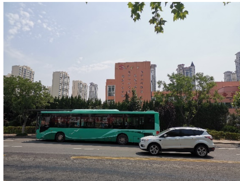
东侧峨眉山路对面江山路第一小学