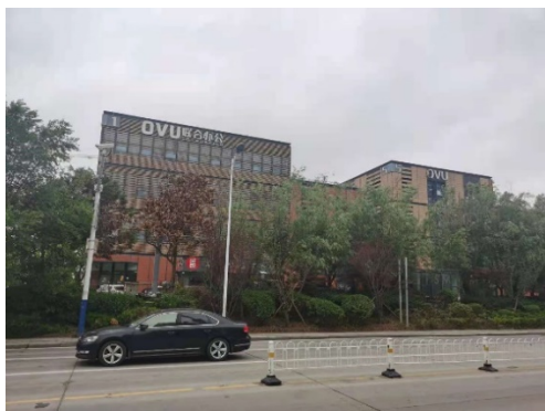
南侧联合办公写字楼