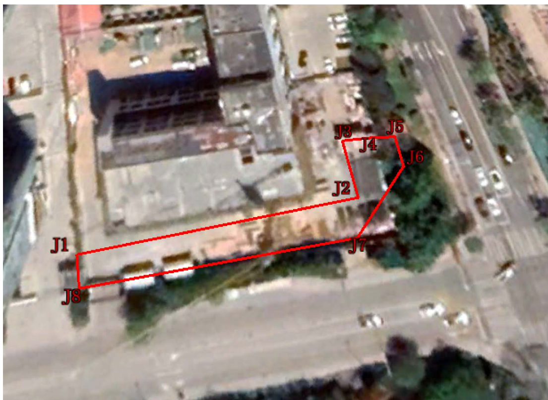
图 1-1 黄岛区灵海路以北、朝阳山路以东地块调查范围图