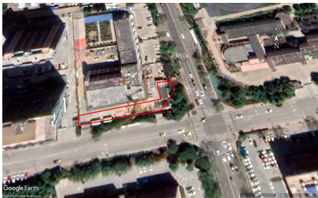
图 2-7 2021 年 05 月 Google Earth 卫星影像图

根据 2019 年 09 月 Google Earth 卫星影像图，调查地块内已被拆除，为一片空地。