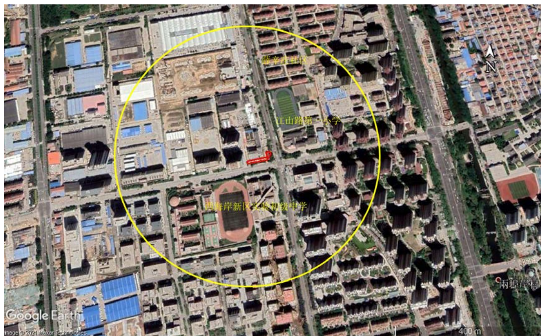
图 2-16 富春江路北、峨眉山路西地块四周敏感目标位置

灵海路以北、朝阳山路以东地块边界四周 500 m 范围内的敏感目标主要为居住用地、学校，具体敏感目标如表 2-1 所示。