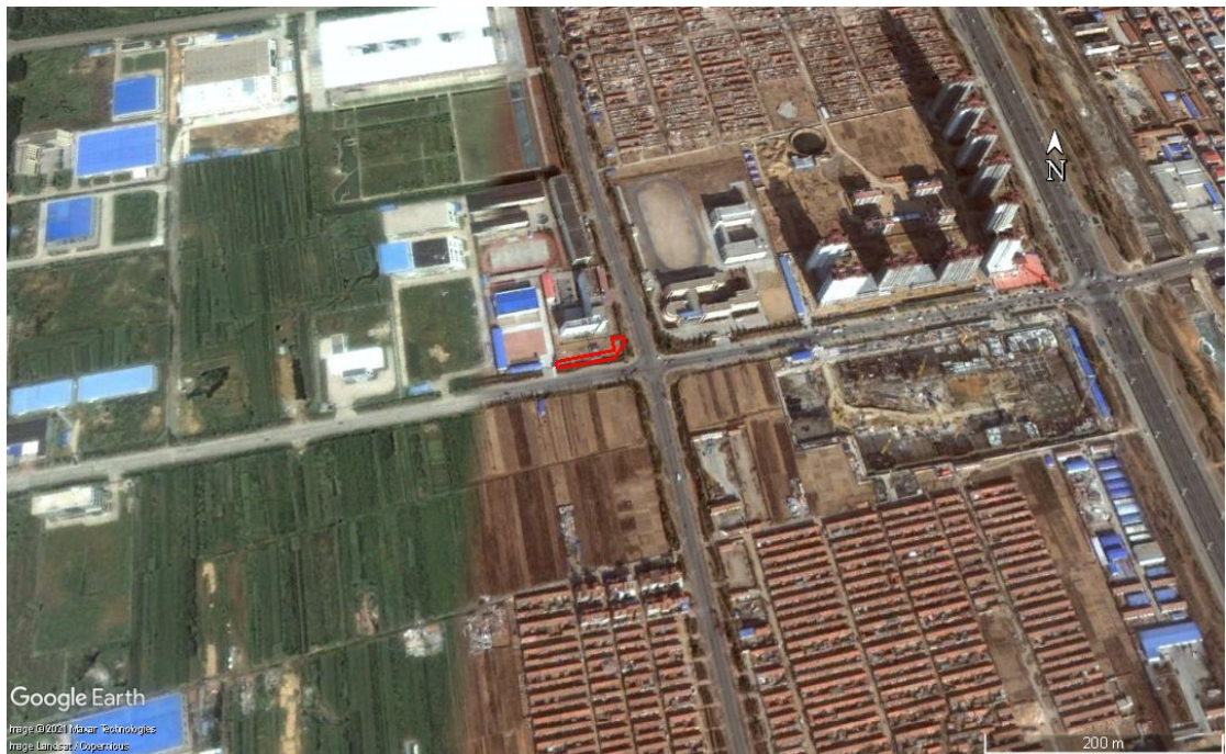
图 2-10 2010 年 01 月 Google Earth 卫星影像图

根据 2005 年 04 月 Google Earth 卫星影像图，调查地块相邻地块主要为居住用地、商业用地、公共管理与公共服务用地、耕地。