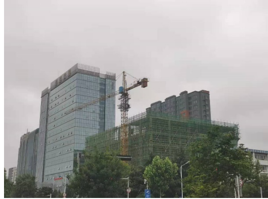
项目内部施工情况