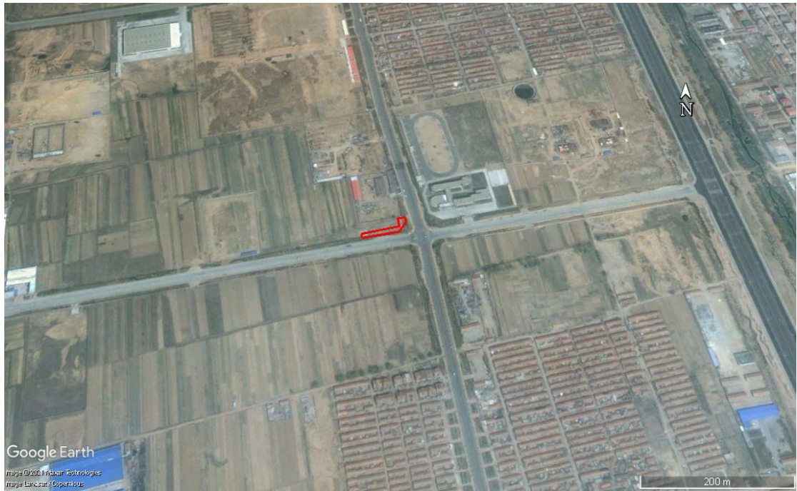
图 2-9 2005 年 04 月 Google Earth 卫星影像图

根据 2005 年 04 月 Google Earth 卫星影像图，调查地块相邻地块主要为居住用地、商业用地、公共管理与公共服务用地、耕地。