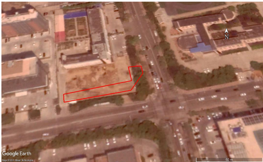
图 2-6 2019 年 09 月 Google Earth 卫星影像图

根据 2016 年 12 月 Google Earth 卫星影像图，调查地块西侧绿化被清除。