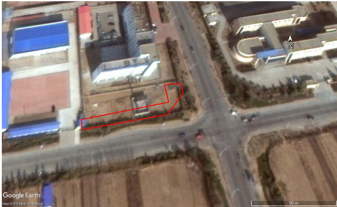
图 2-3 2010 年 01 月 Google Earth 卫星影像图

根据 2010 年 1 月 Google Earth 卫星影像图，调查地块中部偏北位置建设有一栋小型的楼房。