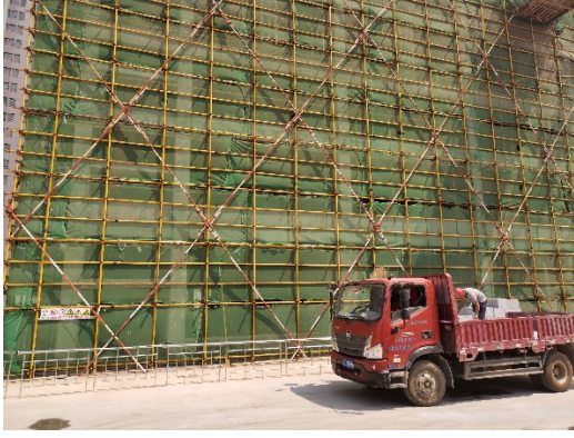
项目内部施工情况