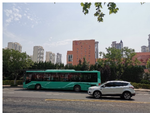
东侧峨眉山路对面江山路第一小学